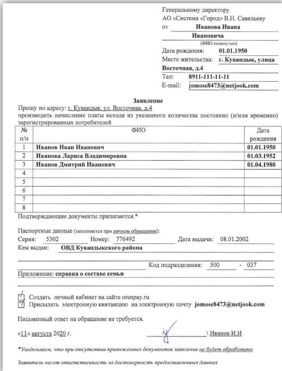
Рис. 4 – Образец заполнения заявления

5. Далее вложить скан-копию подтверждающего документа (справка с паспортного стола о составе семьи/справка из администрации сельсовета о количестве постоянно/временно проживающих потребителей, выданная на основании записи из похозяйственной книги);